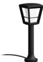
Econic Wand- und Sockelleuchte