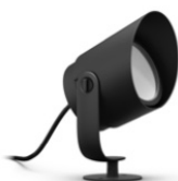
Lily XL Outdoor Spot