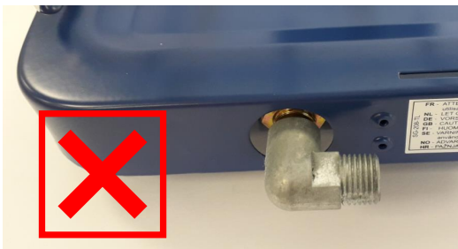
Silberfarbener, rechtwinkliger Anschluss